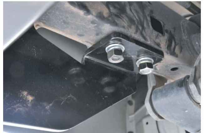
ภาพที่ 2. ติดตั้งชุดลากเข้ากับแชนซี